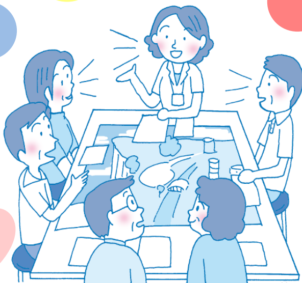
イラスト：小林ちか子

糖尿病カンバセーション・マップは、糖尿病のある人がグループになり、医療者のファシリテーションのもと、糖尿病の知識や体験を話し合い、お互いに学びあう新しい糖尿病教育資材です。